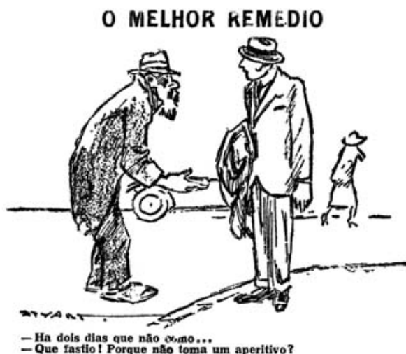
Figura 2- Carvalhais, Stuart. O Melhor Remédio . Publicado a 26 de Junho de 1923, pelo Diário de Lisboa .

O República , também vespertino, foi outro dos periódicos escolhidos. O primeiro jornal com este título saiu em 1848, contudo a sua publicação foi interrompida entre Outubro de 1918 e Março de 1919 (Tengarrinha, 2006). Relativamente a este jornal, Tengarrinha (2006, p. 222) menciona: