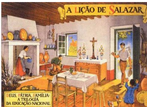
Figura 3 - A lição de Salazar: “Deus, Pátria, Família”. Disponível em < http://www.oliveirasalazar.org/educacao.asp >, acesso a 10 de Janeiro de 2007.

Carvalho (2001, p. 738) faz, por seu turno, alusão às 113 frases 3 (tabela 4) “de carácter moral cuja inserção nos livros de leitura adoptados oficialmente passava a ser obrigatória”. O autor