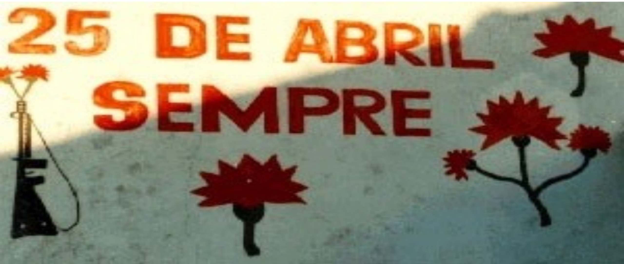
Mural artístico com a seguinte palavra de ordem: 25 de Abril Sempre Local: Cascais – Alcabideche. Nº de registo: 0414. Disponível aqui

Celebre o 47º aniversário do 25 de abril relendo e relembrando algumas das obras de autores lusófonos.