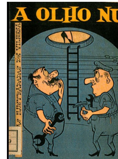
1958, A Olho Nú, José Vilhena, Edição de Autor.