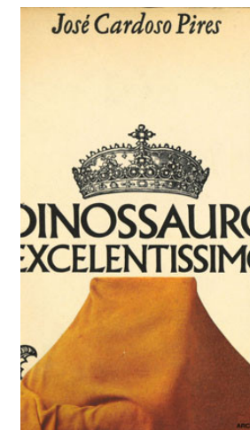
1972, Dinossauro Excelentíssimo, José Cardoso Pires, Arcádia