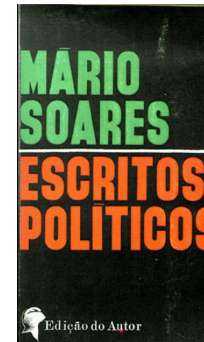
1969, Escritos Políticos, Mário Soares, Edição de Autor