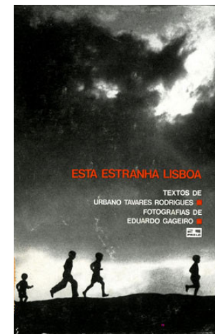
1972, Esta Estranha Lisboa, Urbano Tavares Rodrigues (fotografias de Eduardo Gageiro), Prelo.

Miguel Torga – Bichos, Coimbra Editora, 1953